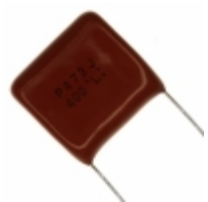
ECQ-P4473JU Panasonic Electronic Components CAP FILM 0.047UF 5% 400VDC RAD