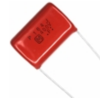
ECQ-P4184JU Panasonic Electronic Components CAP FILM 0.18UF 5% 400VDC RADIAL