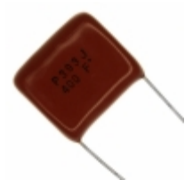
ECQ-P4393JU Panasonic Electronic Components CAP FILM 0.039UF 5% 400VDC RAD