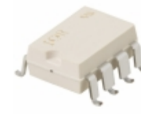
PVI1050NS Infineon Technologies OPTOISO 2.5KV 2CH PHVOLT 8-SMT