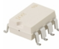
PVI1050NSPBF Infineon Technologies OPTOISO 2.5KV 2CH PHVOLT 8-SMT