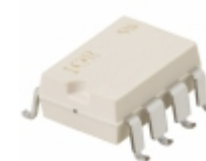
PVI1050NS-T Infineon Technologies OPTOISO 2.5KV 2CH PHVOLT 8-SMT