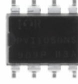
PVI1050NS-TPBF Infineon Technologies OPTOISO 2.5KV 2CH PHVOLT 8-SMT