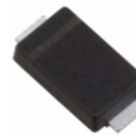
SE30PAD-M3/I Electro-Films (EFI) / Vishay DIODE GEN PURP 200V 3A DO221BC