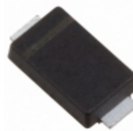
SE30PADHM3/I Electro-Films (EFI) / Vishay DIODE GEN PURP 200V 3A DO221BC