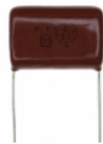
ECQ-P6104JU Panasonic Electronic Components CAP FILM 0.1UF 5% 630VDC RADIAL