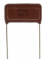
ECQ-P4822JU Panasonic Electronic Components CAP FILM 8200PF 5% 400VDC RADIAL