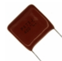
ECQ-P4473JU Panasonic Electronic Components CAP FILM 0.047UF 5% 400VDC RAD