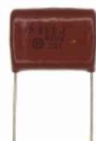
ECQ-P4823JU Panasonic Electronic Components CAP FILM 0.082UF 5% 400VDC RAD