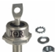
60HFU-100 Vishay Semiconductor Diodes Division DIODE GEN PURP 100V 60A DO203AB