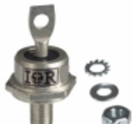
60HFU-300 Electro-Films (EFI) / Vishay DIODE GEN PURP 300V 60A DO203AB