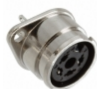
60HA4FX Switchcraft Inc. CONN RCPT 4CONT DIN SLD LOCKRING