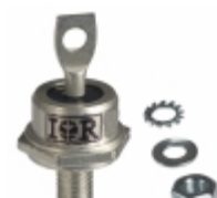
60HFU-200 Vishay Semiconductor Diodes Division DIODE GEN PURP 200V 60A DO203AB