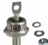
60HFU-400 Vishay Semiconductor Diodes Division DIODE GEN PURP 400V 60A DO203AB