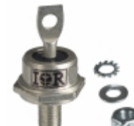
60HFU-400 Electro-Films (EFI) / Vishay DIODE GEN PURP 400V 60A DO203AB