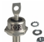
60HFUR-100 Vishay Semiconductor Diodes Division DIODE GEN PURP 100V 60A DO203AB