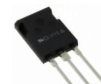
IXKR40N60C IXYS MOSFET N-CH 600V 38A ISOPLUS247