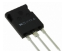
IXKR25N80C IXYS MOSFET N-CH 800V 25A ISOPLUS247