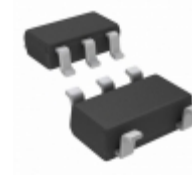
NC7SZD384M5 AMI Semiconductor / ON Semiconductor IC BUS SWITCH 1BIT LEVEL SOT23-5