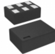
NC7SZD384L6X AMI Semiconductor / ON Semiconductor IC BUS SWITCH 1BIT LEVEL 6MCRPAK