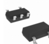
NC7SZ86P5X AMI Semiconductor / ON Semiconductor IC GATE XOR 1CH 2-INP SC70-5