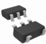
NC7SZD384M5 Fairchild/ON Semiconductor IC BUS SWITCH 1BIT LEVEL SOT23-5