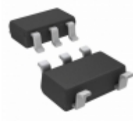
NC7SZD384M5X Fairchild/ON Semiconductor IC BUS SWITCH 1BIT LEVEL SOT23-5