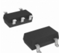
NC7SZ86P5X Fairchild/ON Semiconductor IC GATE XOR 1CH 2-INP SC-70-5