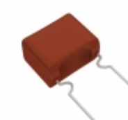
ECW-F2685HAB Panasonic Electronic Components CAP FILM 6.8UF 3% 250VDC RADIAL