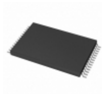
AT28BV64B-20TA Microchip Technology IC EEPROM 64KBIT 200NS 28TSOP