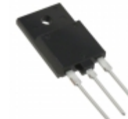
DHG20I600HA IXYS DIODE GEN PURP 600V 20A TO247