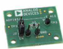
ADP165CB-EVALZ ADI (Analog Devices, Inc.) EVAL BOARD FOR ADP165CB