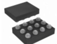
ADP1660ACBZ-R7 Analog Devices Inc. IC LED DRIVER RGLTR DIM 12WLCSP