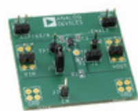
ADP165UJ-EVALZ ADI (Analog Devices, Inc.) EVAL BOARD FOR ADP165UJ