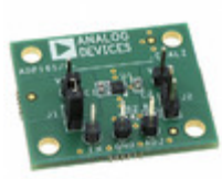
ADP165CP-EVALZ ADI (Analog Devices, Inc.) EVAL BOARD FOR ADP165CP