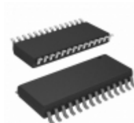
ICL3243EIA Intersil IC TXRX RS-232 3-5.5V ESD 28SSOP