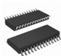
ICL3243EIAZ Intersil IC TXRX RS232 3-5.5V 28SSOP