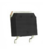
IXST30N60B IXYS IGBT 600V 55A 200W TO268