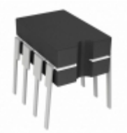
TC4429MJA Microchip Technology IC MOSFET DRIVER 6A INV 8CDIP