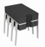
TC4429IJA Microchip Technology IC MOSFET DRIVER 6A INV 8CDIP