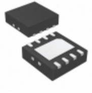
TC4429VMF713 Microchip Technology IC MOSFET DRIVER 6A HS 8DFN