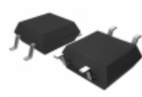
BU4827F-TR Rohm Semiconductor IC VOLT DETECTOR 2.7V SOP4