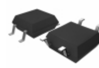
BU4829F-TR Rohm Semiconductor IC VOLT DETECTOR 2.9V SOP4