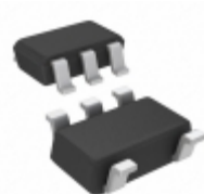
LK112M33TR STMicroelectronics IC REG LDO 3.3V 0.15A SOT23-5