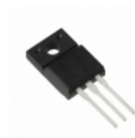
BA08ST Rohm Semiconductor IC REG LDO 8V 1A TO-220FP