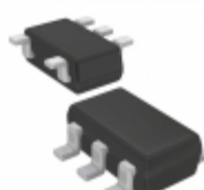
ADM823TYRJ-R7 ADI (Analog Devices, Inc.) IC SUPERVISOR W/RESET SOT23-5