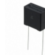
ECQ-UAAF334M Panasonic Electronic Components CAP FILM 0.33UF 20% 275VAC RAD