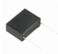
ECQ-UAAF155M Panasonic Electronic Components CAP FILM 1.5UF 20% 275VAC RADIAL