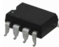
LBB126STR IXYS Integrated Circuits Division RELAY OPTOMOS 170MA DP-NC 8-SMD