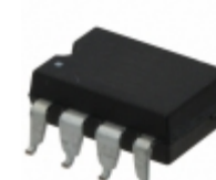
LBB120HS IXYS Integrated Circuits Division RELAY OPTOMOS 170MA DP-NC 8-SMD