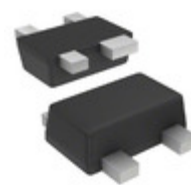
BFU630F,115 NXP USA Inc. TRANSISTOR NPN SOT343F