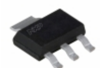
BFU590GX NXP USA Inc. TRANS RF NPN 12V 200MA SOT223-4