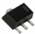
BFU590QX NXP USA Inc. TRANS RF NPN 12V 200MA SOT89-3