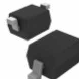
BA782S-E3-18 Electro-Films (EFI) / Vishay DIODE BAND SW 100MA SOD323