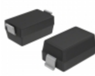
BA782-HG3-18 Electro-Films (EFI) / Vishay DIODE BAND SW 100MA SOD123