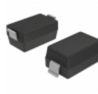
BA782-HG3-18 Vishay Semiconductor Diodes Division DIODE BAND SW 100MA SOD123