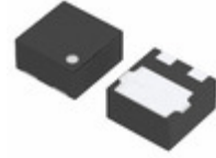
XC6120C112HR-G Torex Semiconductor Ltd IC SUPERVISOR 1.1V 3-USP