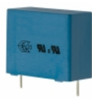
B32914A3474M EPCOS (TDK) CAP FILM 0.47UF 20% 760VDC RAD