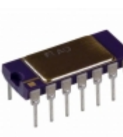
AD534JD Analog Devices Inc. IC TRIMMED MULTIPLIER/DIV 14-DIP