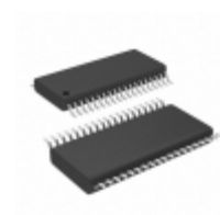
AD5348BRU-REEL Analog Devices Inc. IC DAC 12BIT OCTAL VOUT 38-TSSOP