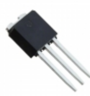
L78M05CDT-1 STMicroelectronics IC REG LDO 5V 0.5A IPAK