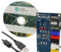
DS3231MZEVKIT# Maxim Integrated BOARD EVAL RTC FOR DS3231M