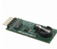
DS3231MPMB1# Maxim Integrated BOARD EVAL RTC DS3231M