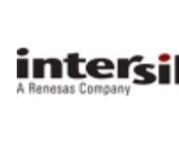
EL5525IRE Intersil IC VREF GEN 18CH TFTLCD 38HTSSOP