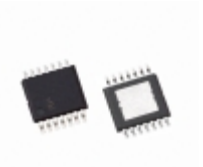
EL5524IRE-T7 Intersil IC BUFFER 4XGAMMA 5.4MA 14HTSSOP