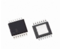
EL5524IRE-T13 Intersil IC BUFFER 4XGAMMA 5.4MA 14HTSSOP