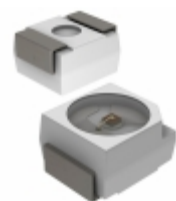
SMLZ14WBEPW1 Rohm Semiconductor LED WHITE DIFFUSED 2PLCC SMD