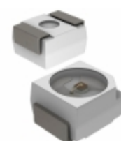
SMLZ14WBEPW1 Rohm Semiconductor LED WHITE DIFFUSED 2PLCC SMD