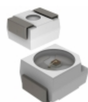
SMLZ14WBECW1 Rohm Semiconductor LED WHITE DIFFUSED 2PLCC SMD