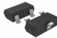
LT1460KCS3-2.5#TRMPBF Linear Technology IC VREF SERIES 2.5V SOT23-3