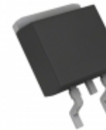
BA7810FP-E2 Rohm Semiconductor IC REG LDO 10V 1A TO252-3