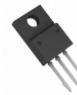
BA7809CP-E2 Rohm Semiconductor IC REG LDO 9V 1A TO220CP-3