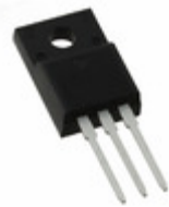
IXFP60N25X3M IXYS Corporation MOSFET N-CH 250V 60A TO220AB