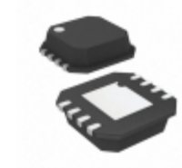
AD8099ACPZ-REEL Analog Devices Inc. IC OPAMP VFB 510MHZ 8CSP