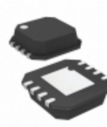
AD8099ACPZ-R2 Analog Devices Inc. IC OPAMP VF ULN ULDIST 8LFCSP