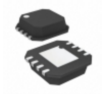
AD8099ACP-R2 Analog Devices Inc. IC OPAMP VFB 510MHZ 8CSP