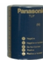
ECE-P2GP152HX Panasonic Electronic Components CAP ALUM 1500UF 20% 400V SNAP