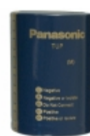
ECE-P2HP102HA Panasonic Electronic Components CAP ALUM 1000UF 20% 500V SNAP