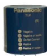
ECE-P2HP561HA Panasonic Electronic Components CAP ALUM 560UF 20% 500V SNAP