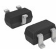
DTC143EET1 ON Semiconductor TRANS PREBIAS NPN 200MW SC75