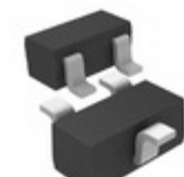
DTC143EETL Rohm Semiconductor TRANS PREBIAS NPN 150MW EMT3