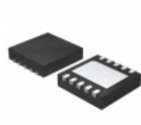
MCP4642T-502E/MF Microchip Technology IC DGTL POT 5K 129TAPS 10-DFN