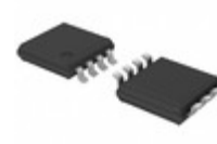
74HCT2G00DP,125 Nexperia USA Inc. IC GATE NAND 2CH 2-INP 8-TSSOP