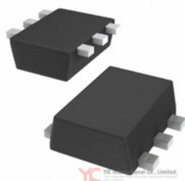
Image may be representation. See specs for product details.