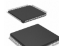
ATF1508AS-10AU100 Microchip Technology IC CPLD 128MC 10NS 100TQFP