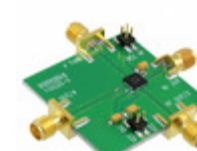
110227-HMC513LP5 Analog Devices Inc. BOARD EVAL HMC513LP5E