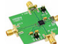
110227-HMC529LP5 Analog Devices Inc. BOARD EVAL HMC529LP5E