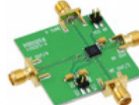
110227-HMC510LP5 Analog Devices Inc. BOARD EVAL HMC510LP5E