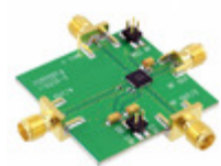
110227-HMC511LP5 Analog Devices Inc. BOARD EVAL HMC511LP5E