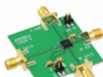
110227-HMC515LP5 Analog Devices Inc. BOARD EVAL HMC515LP5E