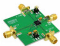
110227-HMC509LP5 ADI (Analog Devices, Inc.) BOARD EVAL HMC509LP5E