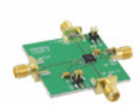
110227-HMC534LP5 ADI (Analog Devices, Inc.) BOARD EVAL HMC534LP5E