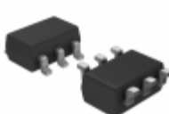
MIC5321-SLYD6-TR Microchip Technology IC REG LDO 3.3V/2.7V TSOT23-6