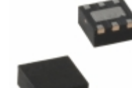
MIC5321-SSYML-TR Microchip Technology IC REG LDO 3.3V 0.15A 6MLF