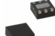
MIC5321-SLYMT-TR Microchip Technology IC REG LDO 3.3V/2.7V 0.15A 6TMLF