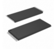
AT28C010-15TU-T Micrel / Microchip Technology IC EEPROM 1M PARALLEL 32TSSOP