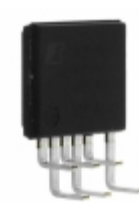
TOP256LN Power Integrations IC OFFLINE SWIT PROG OVP 7FESIP