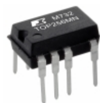
TOP256MN Power Integrations IC OFFLINE SWIT PROG OVP 10CSDIP