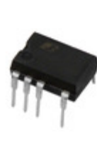
TOP256MG Power Integrations IC OFFLINE SWIT PROG OVP 10SDIP