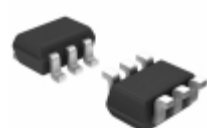
LTC3525ISC6-3.3#TRPBF Linear Technology IC REG BST 3.3V 0.4A SYNC SC70-6