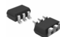
LTC3525ISC6-3.3#TRPBF ADI (Analog Devices, Inc.) IC REG BST 3.3V 0.4A SYNC SC70-6