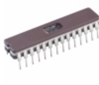
PIC16C745/JW Microchip Technology IC MCU 8BIT 14KB EPROM 28CDIP