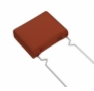
ECW-FA2J154JQ Panasonic Electronic Components CAP FILM 0.15UF 5% 630VDC RADIAL