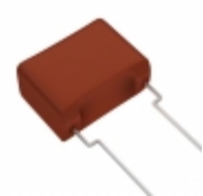
ECW-FA2J155JB Panasonic Electronic Components CAP FILM 1.5UF 5% 630VDC RADIAL