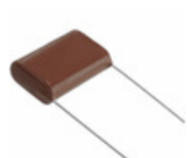
ECQ-E6824JFB Panasonic Electronic Components CAP FILM 0.82UF 5% 630VDC RADIAL