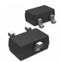
MIC810JYC3-TR Microchip Technology IC RESET GEN 4.63V VTH SC70