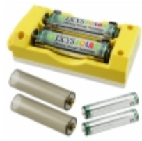
SLBC-01-YEL IXYS Corporation SOLAR BATTERY CHARGER YELLOW