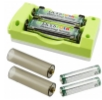
SLBC-01-GRN IXYS Corporation SOLAR BATTERY CHARGER GREEN