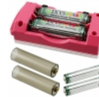
SLBC-01-PNK IXYS Corporation SOLAR BATTERY CHARGER PINK