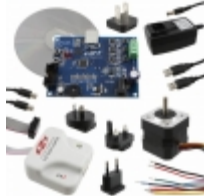
SLBLDC-MTR-RD Energy Micro (Silicon Labs) KIT REF DESIGN SENSORLESS BLDC