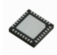
SLB9670XQ20FW760XUMA1 Infineon Technologies SECURITY IC'S/AUTHENTICATION IC'