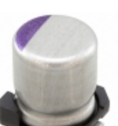
16SVPS39M Panasonic Electronic Components CAP ALUM POLY 39UF 20% 16V SMD