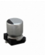
16SZV10M4X5.5 Rubycon CAP ALUM 10UF 20% 16V SMD