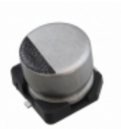
16SZV47M6.3X5.5 Rubycon CAP ALUM 47UF 20% 16V SMD