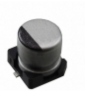
16SZV22M5X5.5 Rubycon CAP ALUM 22UF 20% 16V SMD