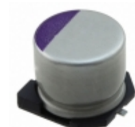
16SVPS82M Panasonic Electronic Components CAP ALUM POLY 82UF 20% 16V SMD