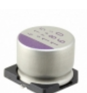
16SVPS180M Panasonic Electronic Components CAP ALUM POLY 180UF 20% 16V SMD