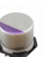
16SVQP39M Panasonic CAP ALUM POLY 39UF 20% 16V SMD