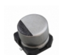
16SZV33M6.3X5.5 Rubycon CAP ALUM 33UF 20% 16V SMD